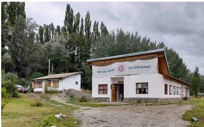
El Mercado en el año 2020

Y así fue como el mercado fue creciendo y echando raíces. La cantidad de productores aumentó, se incorporaron artesanos con sus obras de arte dando color y calidez al espacio. También el Mercado se fue transformando en un punto de interés turístico dada la diversidad de productos artesanales y regionales que ofrece.